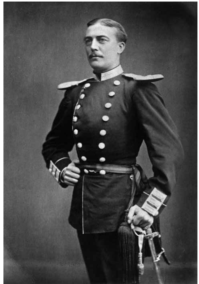
Victor Erland Reuterswård (III) 1848 – 1932