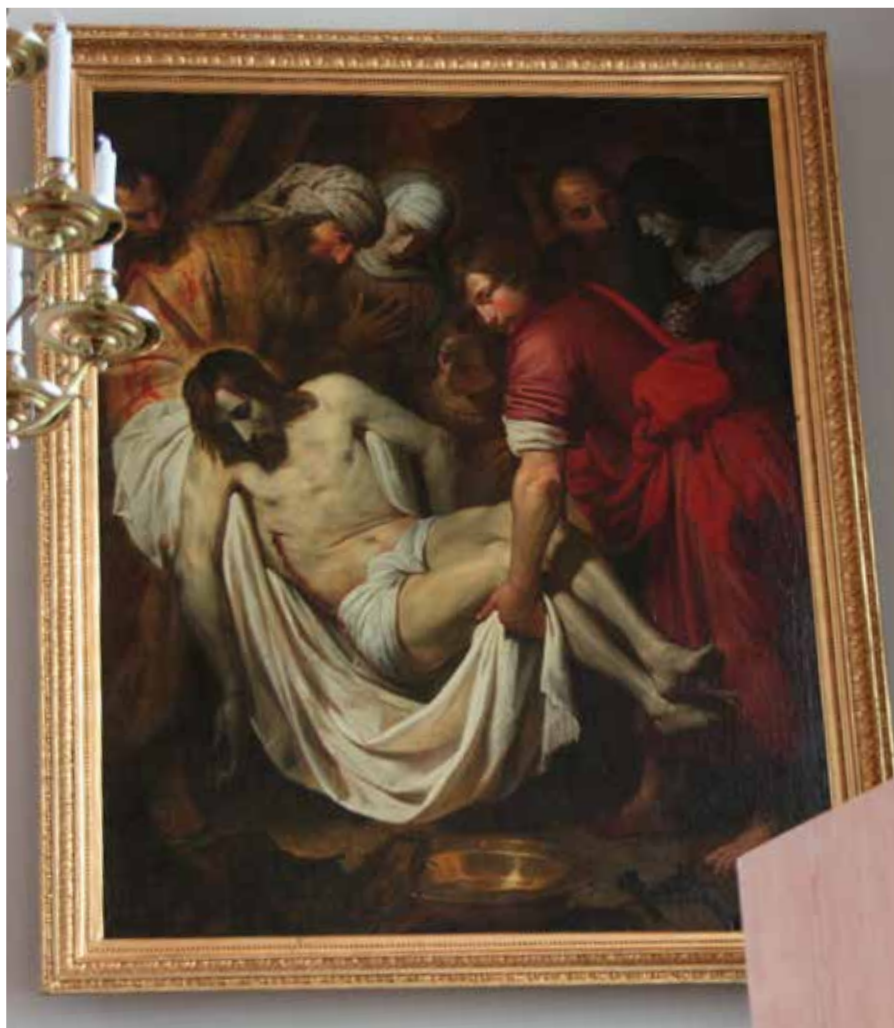
Målningen Gravläggningen i Skinnskattebergs kyrka