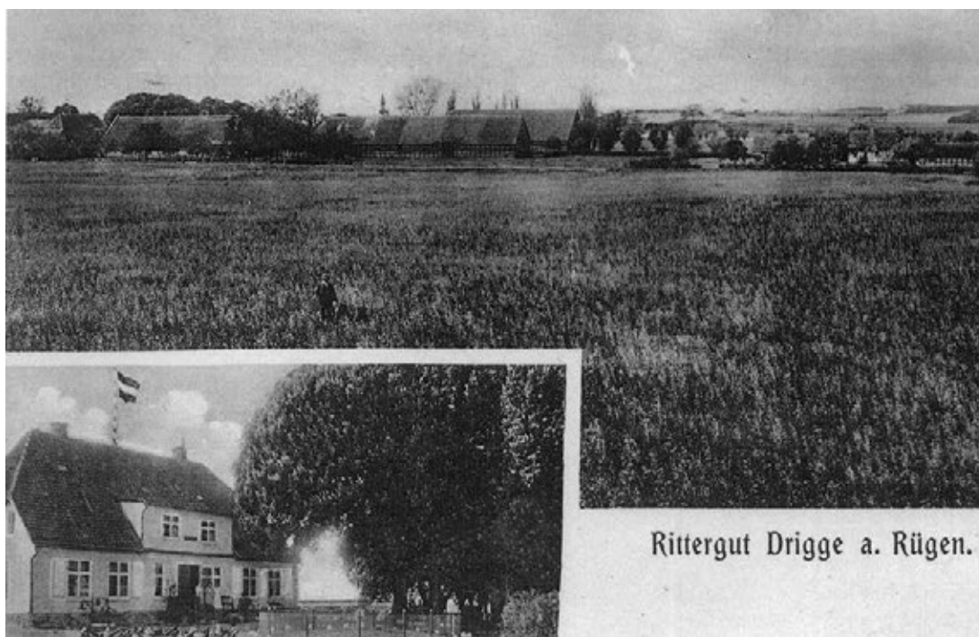
Rittergut Drigge a. Rügen.

/Mer att läsa om detta i släktboken sidan 15 och framåt. Sättra och Stora Lund samt kyrkorna har besetts under en av våra släktresor/.