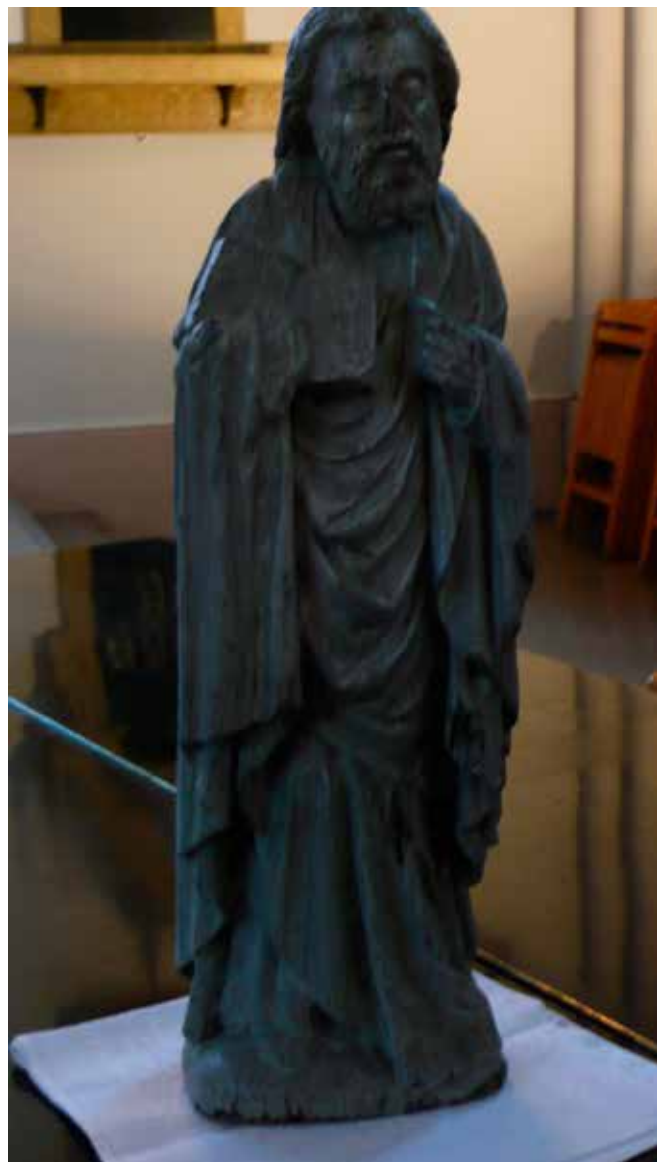
En av de kvarvarande trästatyetterna