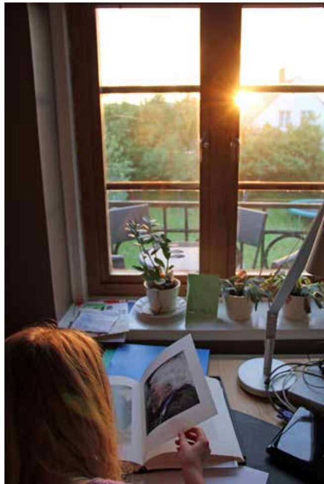
Emelie får inspiration av konstboken "Style is Fraud", av CFR.

1969 inträffar ny kris: CF som gift man med 4 minderåriga barn samt egen förortsvilla, ger en läsning som CF inte hade räknat med. Hans framtid som spektakulär konstnär tycktes hotad. Alternativet var att totalt göra om tillvaron, göra tvärtom.